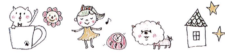
イラスト：ノンコ（消しゴムはんこをモデルハウスで販売しています）