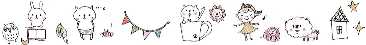
イラスト：ノンコ（消しゴムはんこをモデルハウスで販売しています）